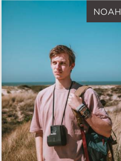
NOAH S, OKLAHOMA

ostionica Tava mi je pružila savršeno mjesto za opuštanje nakon dana istraživanja Tuzle. Vodič mi je pomogao da pronađem najbolja mjesta za posjetiti, a preporuke za restoran su bile tačne - hrana je bila izvanredna! Definitivno se vraćam.