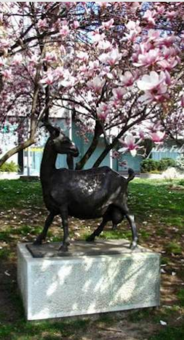
Cijela Tuzla jednu kozu muzla!