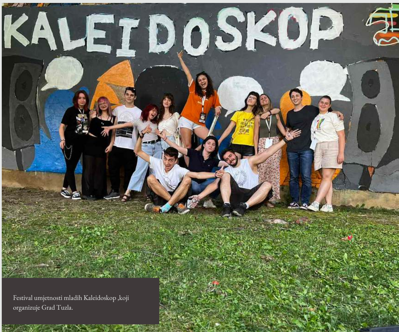
Festival umjetnosti mladih Kaleidoskop, koji organizuje Grad Tuzla.

Tuzla je grad bogate kulture i tradicije, koji kroz stoljeća čuva svoje naslijeđe dok se istovremeno modernizuje i prilagođava novim vremenima. Kultura Tuzle duboko je ukorijenjena u njenoj historiji, a grad je bio važno mjesto još od neolitskog perioda, čemu svjedoče arheološki nalazi i historijski spomenici. Tradicionalno je bio poznat po proizvodnji soli, a to naslijeđe se i danas čuva kroz simboliku i turističke atrakcije, kao što su Panonska jezera.